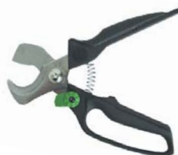
Art. nr. 20 00 84

Te opatentowane nożyce ze stali nierdzewnej uderzają swoją szczególną papuzią formą. Zapobiega ona wysunięciu się kabla i zabezpiecza efektywny proces cięcia. Osłona ręki umożliwia bezpieczną pracę.