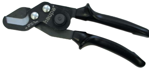
Art. nr. 20 10 00