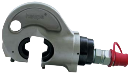
„KC25-12“ Art. 216004