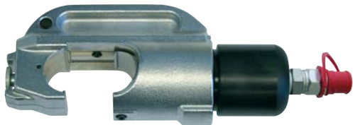
„KC42-12“ Art. 216005